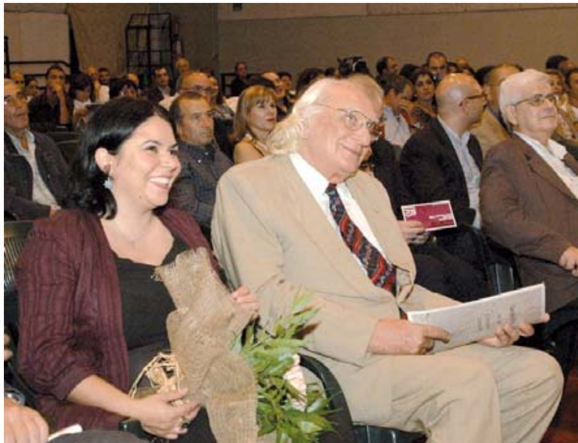
Michela Murgia e Marco Pannella a Villacidro.